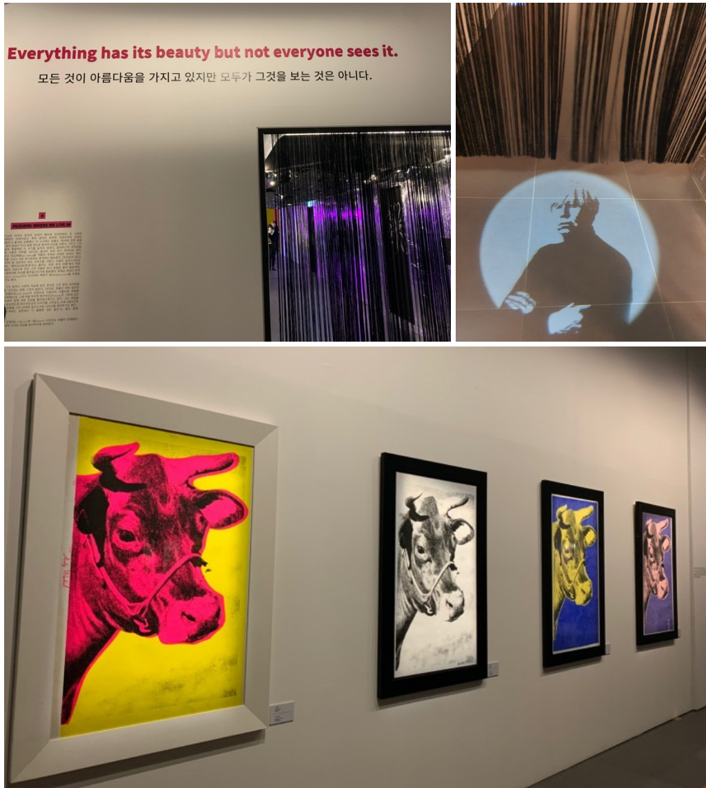
소, 활화산, 중국 정치인 등 다양한 전시를 볼 수 있습니다~

작품의 소재를 인물에서 넓혀 자연, 생물 더 나아가 정치인을 소재로 하는 대범함과 시대를 앞서는 참신함에 또 무릎을 칩니다!!!!