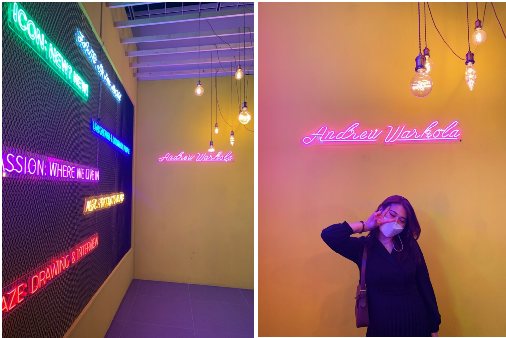
네온 사인과 함께 포토스팟입니다:)