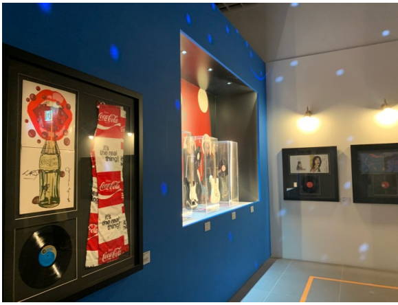
좌) 더벨벳 언더그라운드 앤드 니코