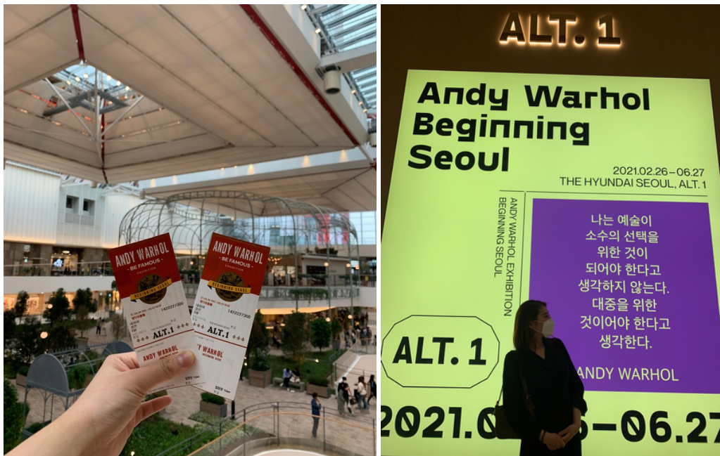
더현대서울 6층 전시관!!