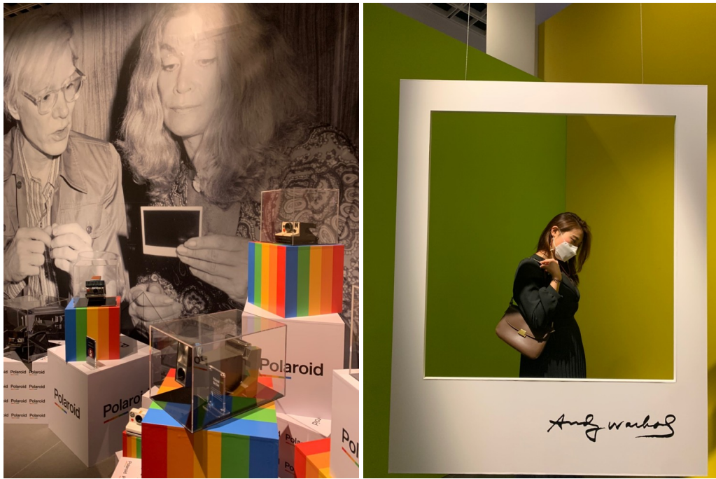
3관 폴라로이드와 시작하는 포토존~!!