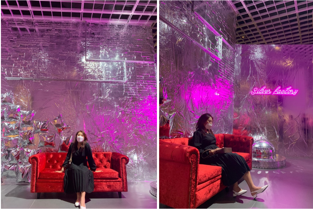
이뿐 척 아니고 진짜 배경이 만들어주는 분위기 느끼기☆

"실버팩토리" 라고 칭한 그의 작업실은 앤디워홀에 작업 공간이자, 파티룸이었대요~ (저에게는 그저 파티룸♡)