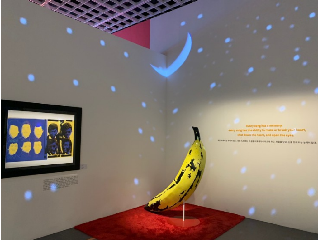
알듯 모를듯한 바나나, 이러면 바나나?

미국의 락 밴드 벨벳 언더그라운드와 독일 출신의 가수 니코 (The Velvet Underground & Nico) 의 프로듀싱을 맡아 앤디워홀이 만든 바나나 앨범 커버